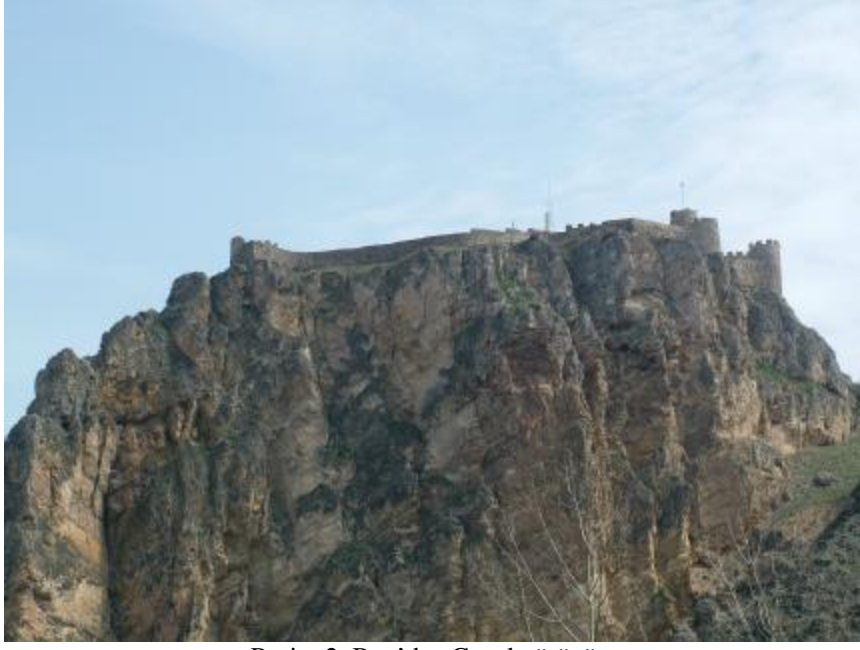
Resim 2. Batı'dan Genel görünüm