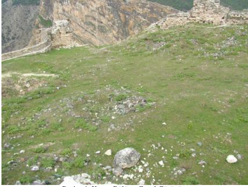
Resim 4. Kuzey Bölüm, Genel Görünüm