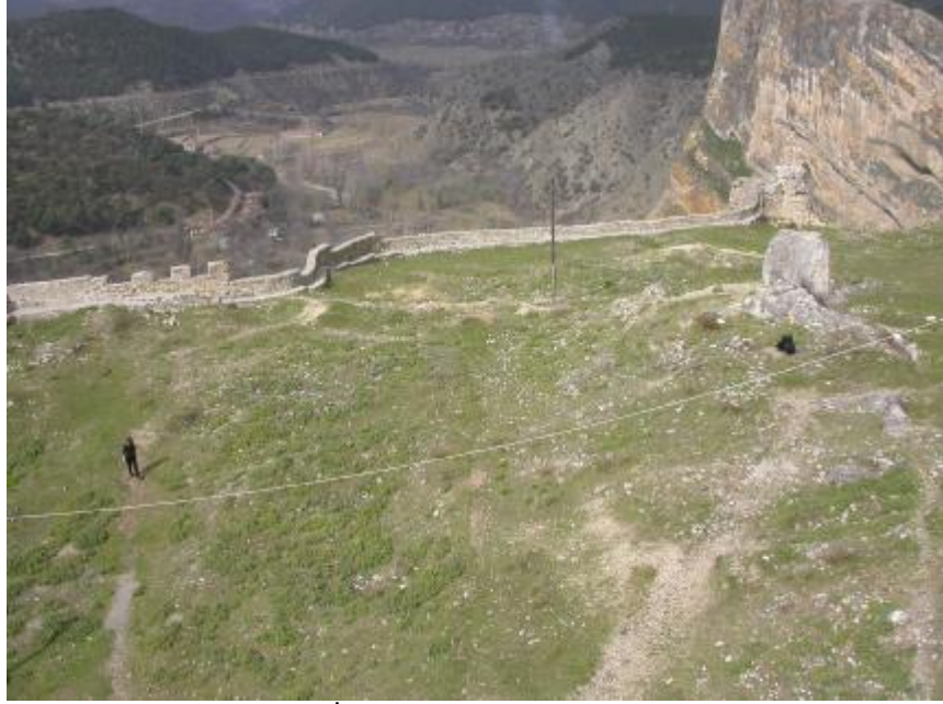
Resim 3. İç Kale, Kuzeybatıya Genel Bakış