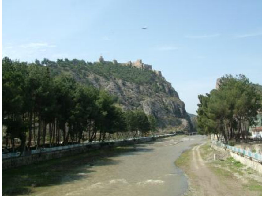
Resim 1. Boyabat Kalesi, Doğu'dan Genel Görünüm