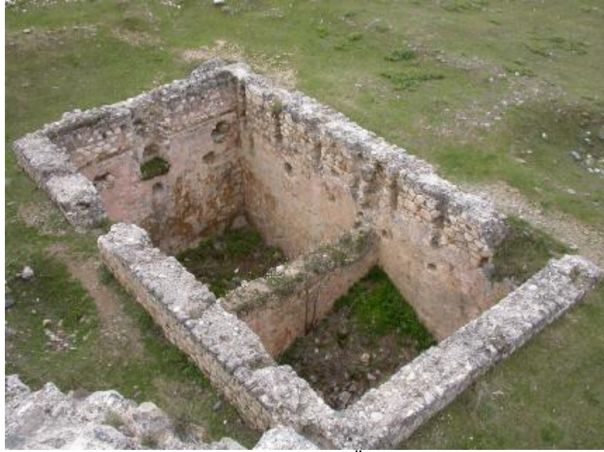
Resim 5. Mescit ve Depo Birimi, Üstten Güneye Bakış