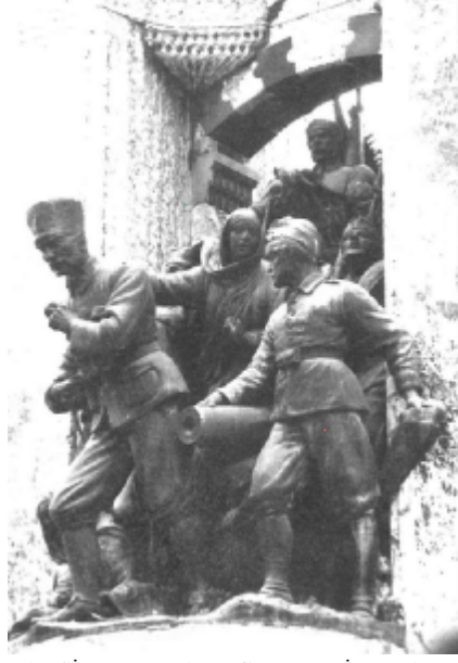
RESİM: 3 İSTANBUL, TAKSİM MEYDANI, CUMHURİYET ANITI, KUZEY CEPHEDEN AYRINTI, KURTULUŞ SAVAŞI KOMPOZİSYONU