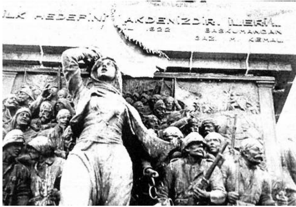
RESİM: 8 İZMİR, CUMHURİYET MEYDANI, ATLI ATATÜRK ANITI, ÖN CEPHE, ZAFER KOMPOZİSYONU