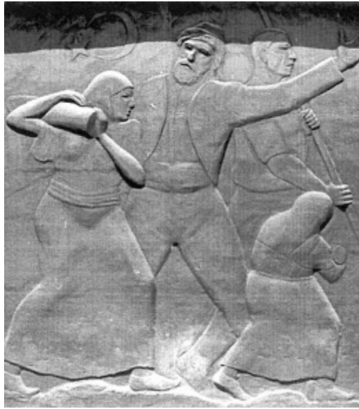
RESİM: 12 ÇANKIRI, ATATÜRK ANITI, ÖNCEPHE, KURTULUŞ ŞAVASI SAHNESİ