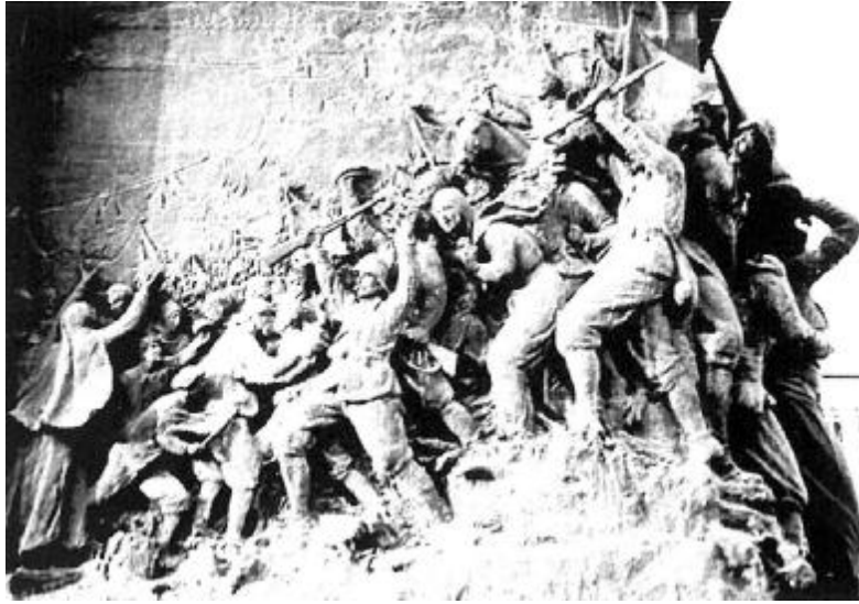
RESİM: 9 ATLI ATATÜRK ANITI, ZAFER