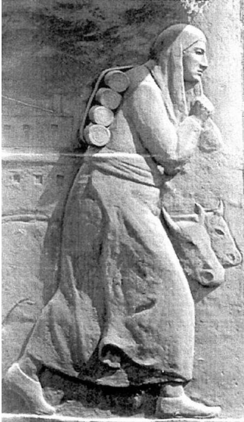
RESİM: 13 ATATÜRK ANITI, SOL CEPHE, KURTULUŞ SAVAŞI SAHNESİ