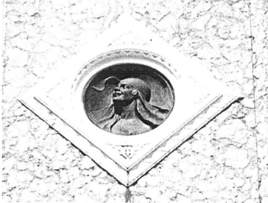
RESİM: 6 CUMHURİYET ANITI, GENÇ KIZ PORTRESİ