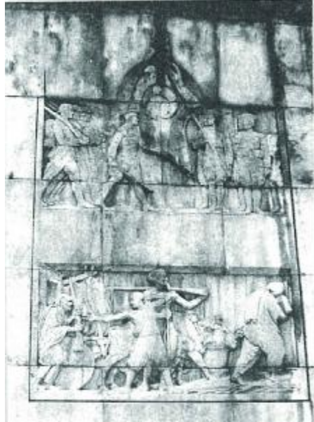
RESİM: 2 ULUS ANITI, TÜRK HALKININ