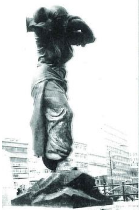
RESİM 1: ANAKARA ULUS MEYDANI, ULUS ANITI, MERMİ TAŞIYAN KADIN FIGÜRÜ