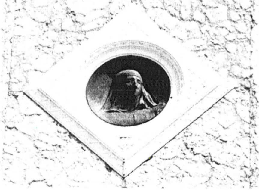
RESİM: 5 CUMHURİYET ANITI, PEÇELİ KADIN