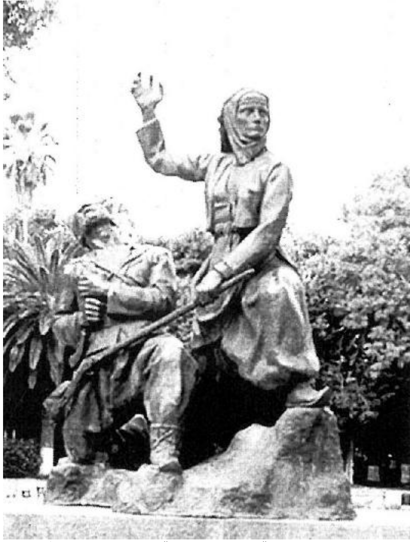
RESİM: 10 ADANA, ATATÜRK PARKI, ATATÜRK (KURTULUŞ) ANITI, GÜNEYDOĞU HEYKEL GRUBU