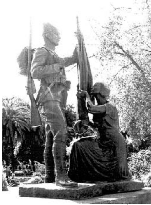
RESİM: 11 ATATÜRK (KURTULUŞ) ANITI, KUZEYDOĞU HEYKEL GRUBU